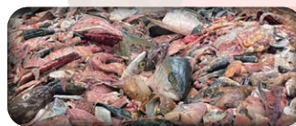
原料となる新鮮な魚のアラ